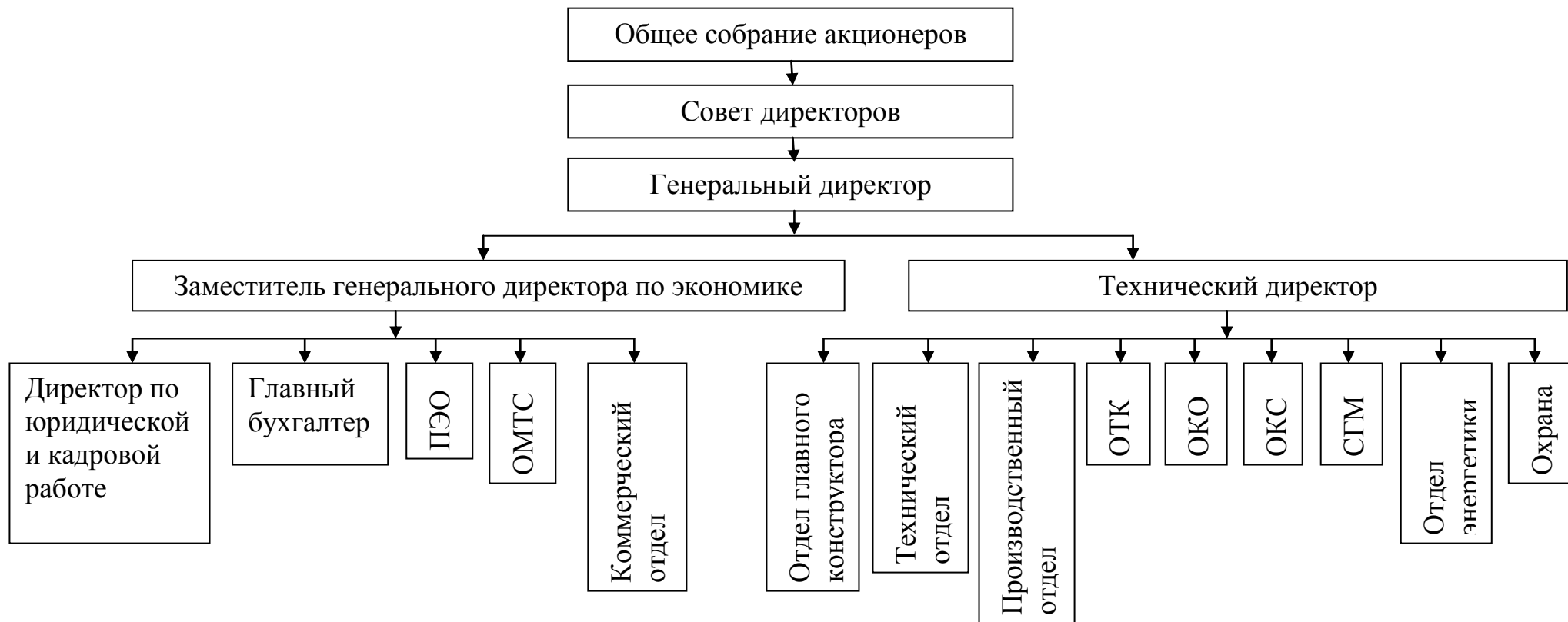
Рисунок К.2 – Организационная структура НАИМЕНОВАНИЕ ПРЕДПРИЯТИЯ