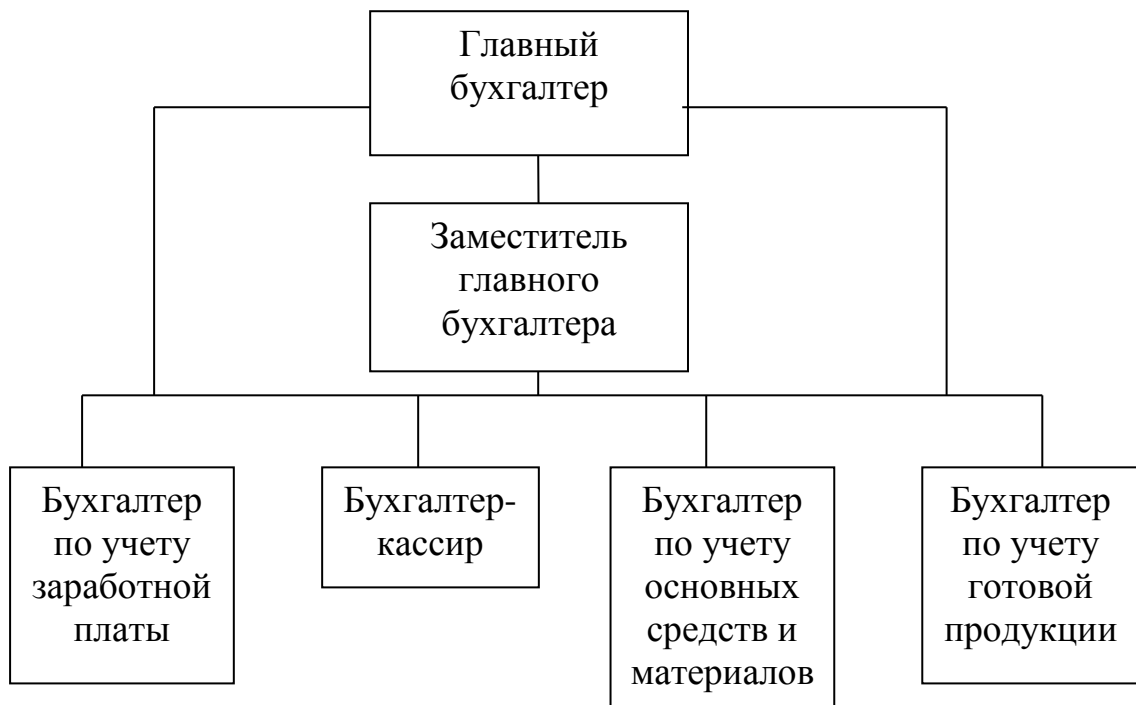
Рисунок Д.2 – Структура аппарата бухгалтерии ООО «Луч»