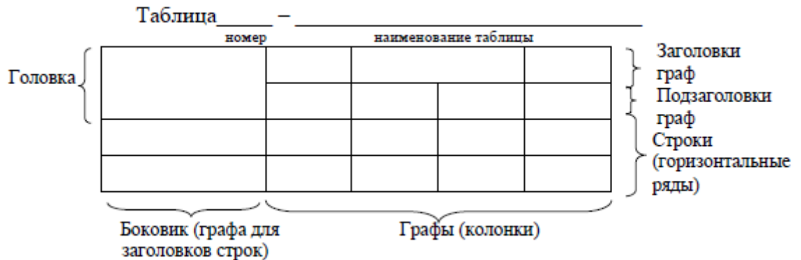
Рисунок 1 – Основные элементы таблицы

Основные элементы таблицы приведены на рисунке 1.